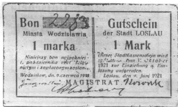
1 mk - wym. 58,5-61,0x103-104 mm