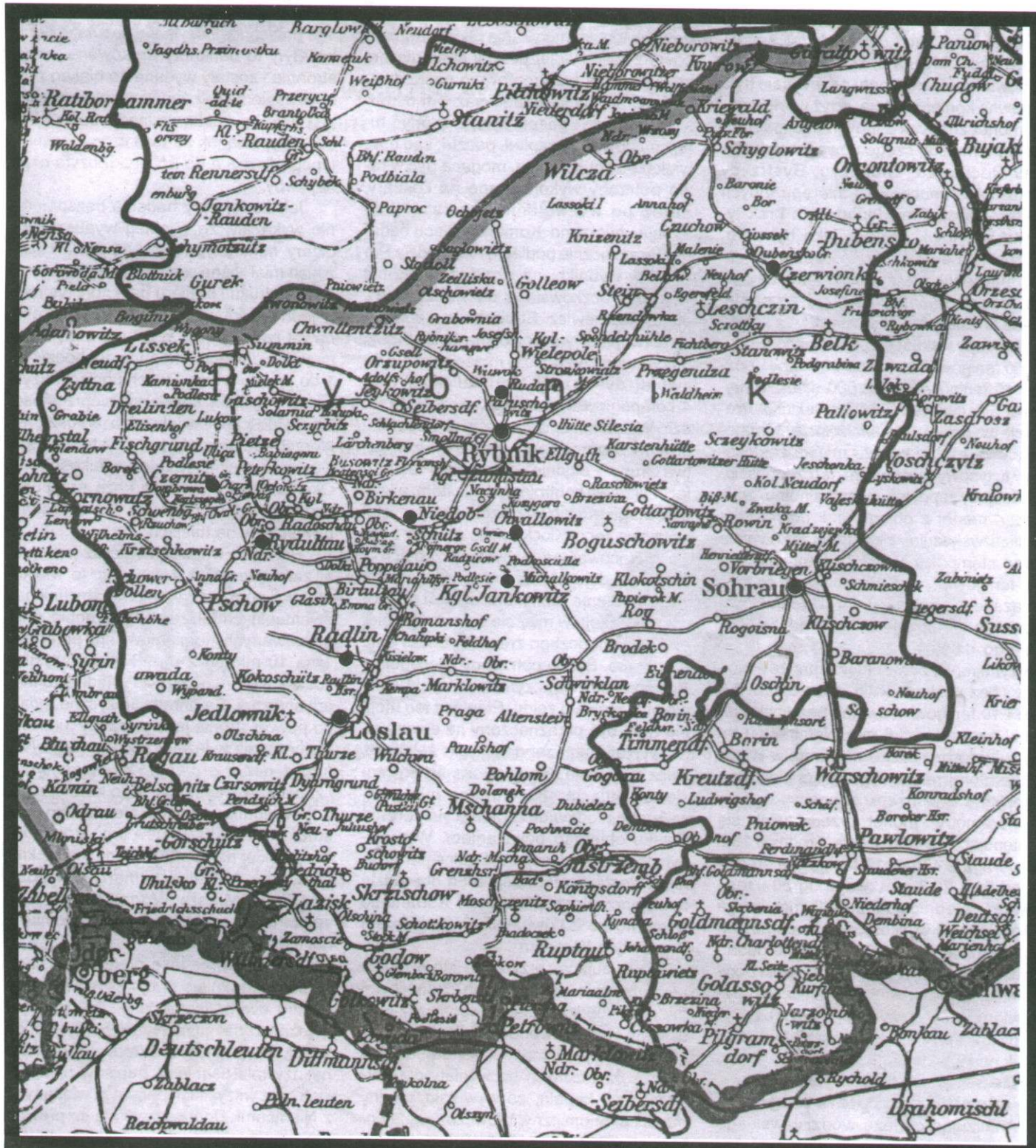
Mapa dawnego powiatu rybnickiego z lat 1921/22 z zaznaczeniem miejscowości, które emitowały pieniądze urzędowy i prywatny :

Chwallowit - Chwałowice Czernica- Czernica Czerwionka - Czerwionka Knurów - Knurów Jankowitz - Jankowice Niedobschutz- Niedobczyce