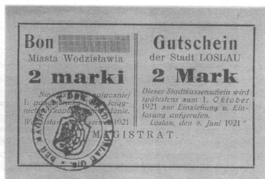
2 mk - wym. 67,0-69,0x10,0 mm