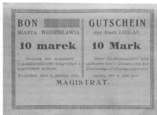
10 mk - wym. 8-8x12 mm