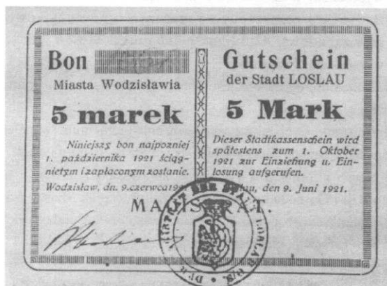
1 mk - wym. 8-8,2x109-11,0 mm